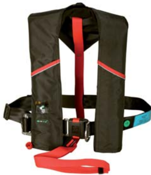
Almindelig 150 N oppustelig redningsvest med integreret sikkerhedssele