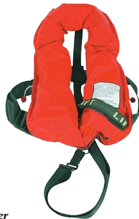
275 N SOLAS godkendt oppustelig redningsvest