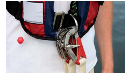
D-ring og livliner

Søsportens Sikkerhedsråd anbefaler, at man til al fritidssejls køber en vest med indbygget sikkerhedssele med D-ring og tilhørende CE-godkendt livline samt skridtrem.