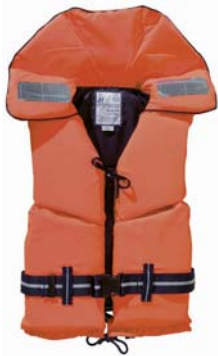
Almindelig fast redningsvest 150 N